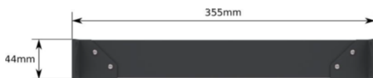
Widok – z góry