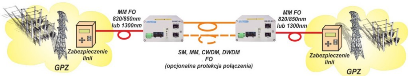
Rys. 1. Przykładowa aplikacja punkt-punkt. Zapewnienie łączności pomiędzy stacjami GPZ w zakresie zabezpieczeń.

Typową aplikację przedstawia rysunek poniżej.